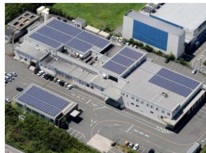
工場屋上のソーラー化